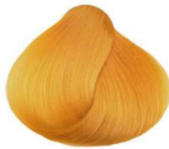
Giallo yellow jaune amarillo أصفر