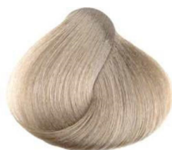
901 super schiarente cenere ash super lightener super décolorant cendré super aclarador ceniza مفتح قوى رمادي