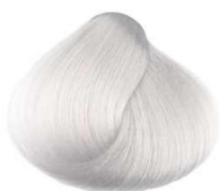
Booster attivatore ultraschiarente super lightener activator activateur ultradécolorant activador ultra-aclarante منشط فعال للتفتيح