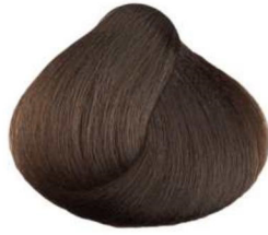
5.032 cioccolato medio medium chocolate chocolat moyen chocolate medio شيكولاته متوسط