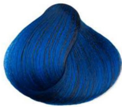
Blu blue bleu azul أزرق