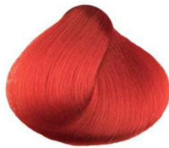
Rosso Extra extra red extra rouge rojo extra أحمر extra