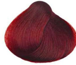
6.62 ciliegia cherry cerise cereza كرزي