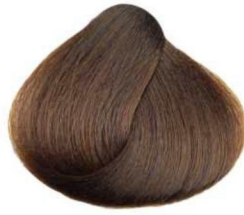
7.34 cannella cinnamon cannelle canela قرفه