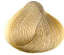
Biondo Svedese swedish blonde blond suédois rubio sueco أشقر سويدي