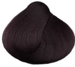
1.2 nero viola violet black noir violet negro violeta أسود بنفسجي