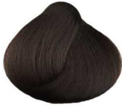
4.032 cioccolato scuro dark chocolate chocolat foncé chocolate oscuro شيكولاته غامق