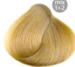
12.33 platino extra dorato extra-golden platinum blond platine extra doré platino extra-dorado بلاتيني ذهبي شديد