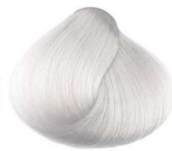
Argento silver argent plata فضی