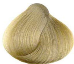
900 super schiarente naturale natural super lightener super décolorant naturel super aclarador natural مفتح قوى طبيعي