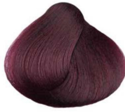
5.2 castano chiaro irisé violet light brown châtain clair irisé castaño claro irisado أشقر فاتح قزحي