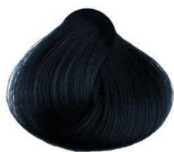
1B nero blu blue black noir bleuté negro azul أسود مزرق