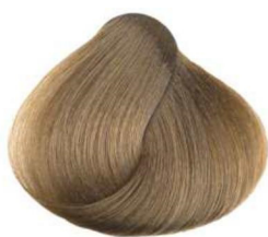
9 biondo chiarissimo very light blonde blond très clair rubio clarísimo أشقر فاتح جداً