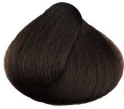
4.34 castagna chestnut châtaigne castaña أبو فروه