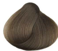
7 biondo blonde blond rubio أشقر