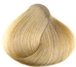
10 biondo extra chiaro extra light blonde blond extra clair rubio extra claro أشقر أفتح مايمكن