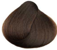
6.34 uvetta raisin raisin sec uva pasa زبيب