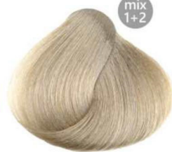
12.01 platino cenere ash platinum blond platine cendre platino ceniza بلاتيني رمادي