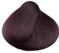
4.2 castano irisé violet brown châtain irisé castaño irisado كستنائي قزحي