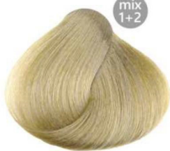
12.00 platino naturale natural platinum blond platine naturel platino natural بلاتيني طبيعي