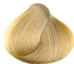
903 super schiarente dorato golden super lightener super décolorant doré super aclarador dorado مفتح قوى ذهبي