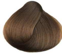
7.32 tabacco tobacco tabac tabaco تبغ