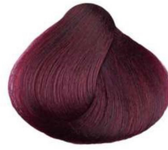
6.2 biondo scuro irisé violet dark blonde blond foncé irisé rubio oscuro irisado أشقر غامق قزحي