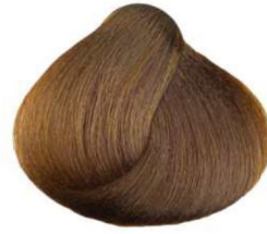
8.37 brandy coñac براندی