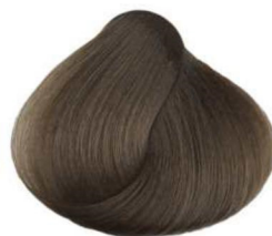
7.00 biondo intenso deep blonde blond intense rubio intenso أشقر داكن