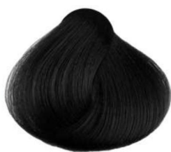
1 nero black noir negro أسود