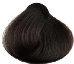
5.00 castano chiaro intenso deep light brown châtain clair intense castaño claro intenso كستنائي فاتح مكثف