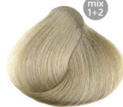
12.91 platino perla cenere ash-pearl platinum blond platine perle cendre platino perla ceniza بلاتيني لؤلؤي رمادي