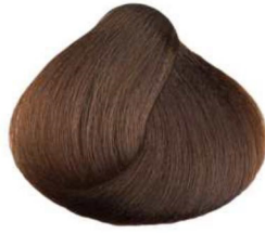
6.032 cioccolato chiaro light chocolate chocolat clair chocolate claro شيكولاته فاتح