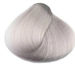
Perla pearl perle لؤلؤنی