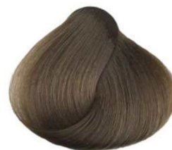
8.00 biondo chiaro intenso deep light blonde blond clair intense rubio claro intenso أشقر فاتح مكثف